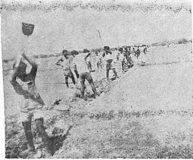
ৰাষ্ট্ৰীয় সেৱা আঁচনিৰ অধীনত কৰ্মৰত অৱস্থাত শিবিৰাৰ্থী সকল শিবিৰ স্থান : ৰাজলীয়াল ( ৰালিজন )